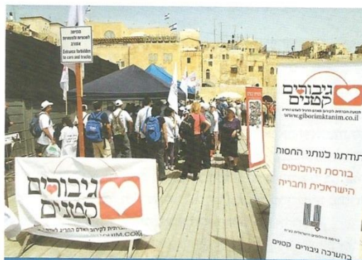
בחגיגת בר המצווה האחרונה התגייסה הבורסה בראשונה כדי לסייע לעמותה לארגן אירוע בר/בת מצווה ליותר מ-500 ילדים, הורים ומלווים

מדי שנה אנחנו חוגגים לילדים בר/בת מצווה בכותל, לאחר שהוכחנו לרב הכותל, שהילדים מבינים את הטקסט ועל כן הם יכולים לעלות לתורה. מאז הפכה חגיגת בר/בת המצווה בכותל לאחר מאירועי הלבה של העמותה שלנו, החוגגת לילדים בשיתוף עם תלמידי ישיבת חורב והקרן למורשת הכותל. השנה, התגייסה הבורסה בראשונה כדי לסייע