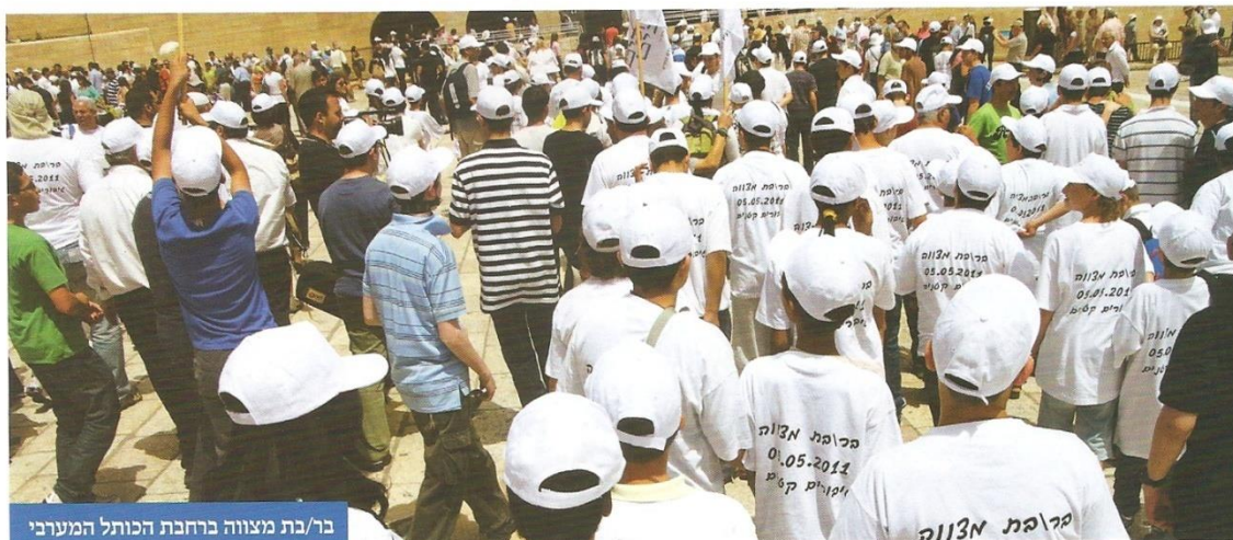
בר/בת מצווה ברחבת הכותל המערבי

וילדים 'רגילים' לבין הילדים המיוחדים, להעניק לילדים מסגרת תומכת ומהנה, ולהכשיר אותם לחיים עצמאיים לאחר סיום הלימודים בבית הספר. בעמותה כ-400 מתנדבים העוסקים בפעילות למען כ-1600 ילדים